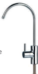
RUBINETTO Miscelatore a 1 vie